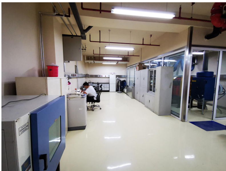
北京离子探针中心选矿实验室全景