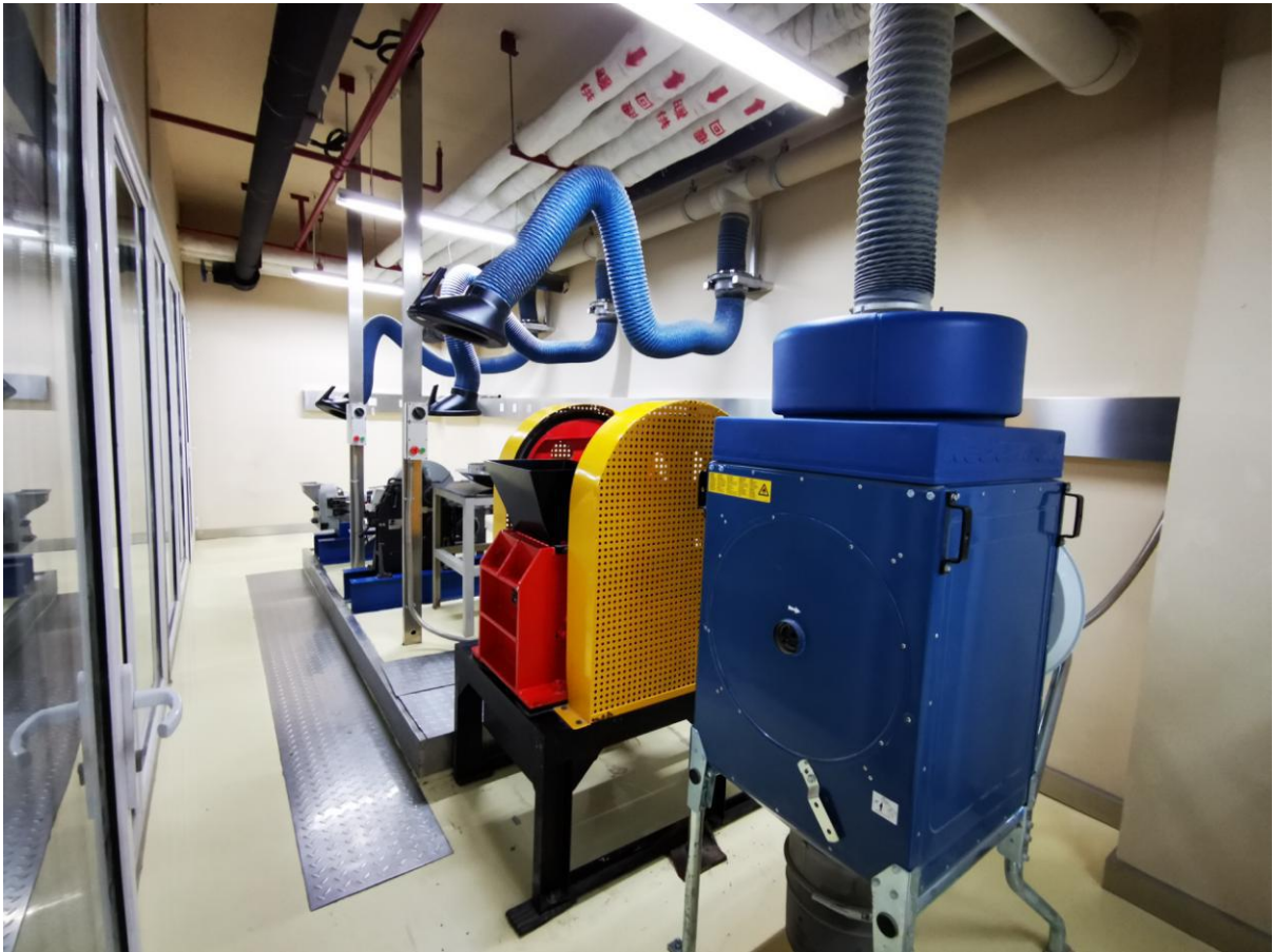
美国 Nederman 实验室除尘机