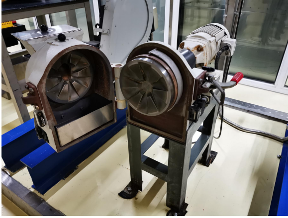
德国 Schmersal 盘磨机