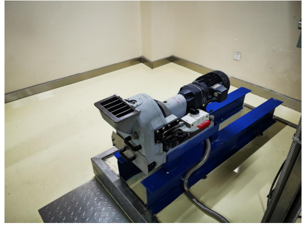
德国 Retsch 盘磨机